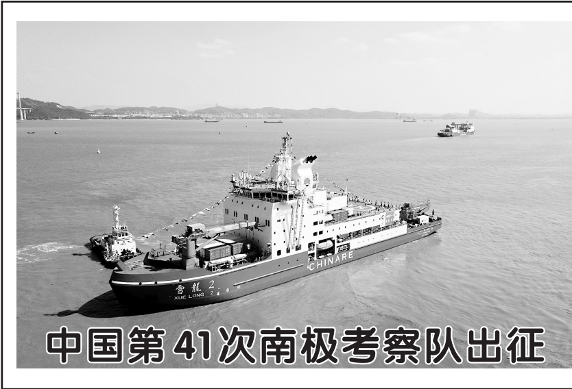
中国第41次南极考察队出征

11月1日,“雪龙”号和“雪龙2”号船从广州南沙国际邮轮母港码头出发(无人机照片)。